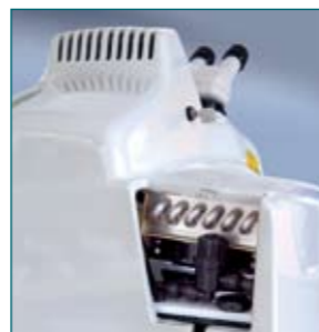
Grafica: Malmo e Boschetti - Stampat: Tip.Venonese - Schio 09/09