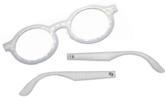
Texture sur métal