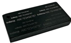
Marquage sur acétate