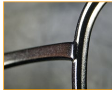
Réparation de composants métalliques de lunettes