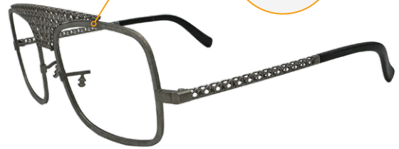
Assemblage par soudage