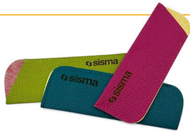
Personnalisation en magasin