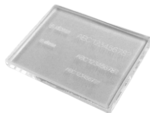
Marquage sur verre