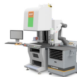
It works with all BSP systems (model 2020 and later) Funzionante con macchina BSP (modello 2020 e successivi)